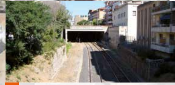
Entrée de la tranchée couverte Travaux réalisés dans le domaine ferroviaire