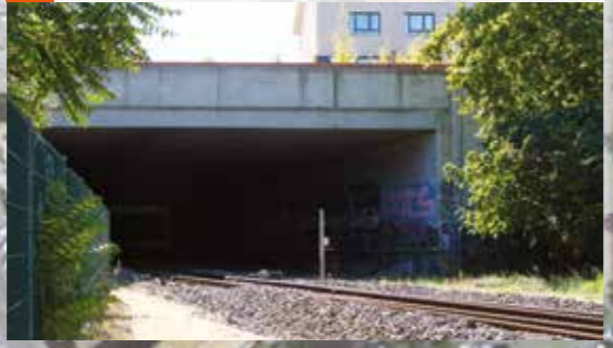
Sortie de la tranchée couverte Travaux réalisés dans le domaine ferroviaire